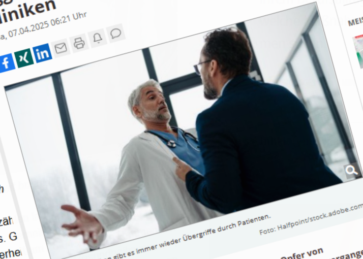
Auch in Kliniken gibt es immer wieder Übergriffe durch Patienten.

Berlin - Krankenhauspersonal wird immer wieder Opfer von körperlichen Attacken am Arbeitsplatz. Beispiel Hessen: Im vergangenen Jahr seien insgesamt 189 Klinikangestellte betroffen gewesen, teilte die Sprecherin des Gesundheitsministeriums in Wiesbaden mit. Unter den Fern waren 34 Ärztinnen und Ärzte sowie 155 Pflegerinnen und